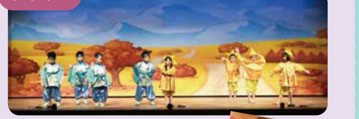
お遊戯会の背景や行事のポスターも禎浩先生がデザインしています!