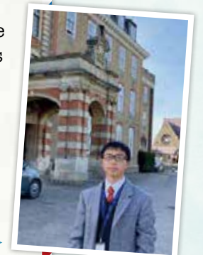
通っている学校の前

Hello, I will talk about the differences between Japanese school and English school. First of all, we use English, and there are a lot of people from many countries. There are two snack times each day, once in the morning and once in the afternoon. There are private lessons for music. There are some showcases. There are ensembles too. We play a lot of sports at school such as netball, cricket, fencing, and tennis.