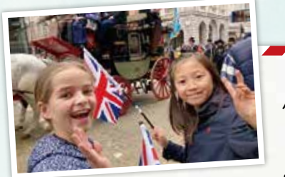
▲「Lord Mayor's Show」パレード