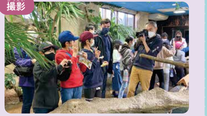
スペシャルデーなどの園外行事や旅行にも同行して撮影します。(写真はプリミアG5の那須どうぶつ王国見学)