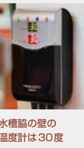
水槽脇の壁の温度計は30度