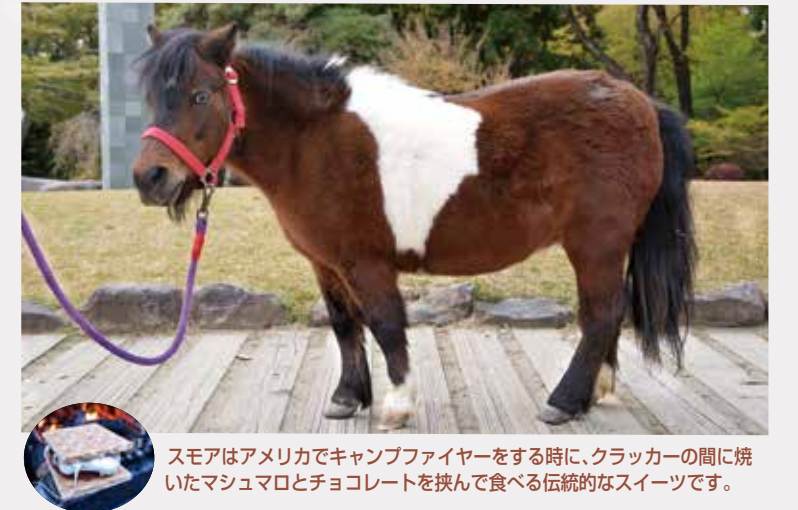
スマオはアメリカでキャンプファイヤーをする時に、クラッカーの間に焼いたマシュマロとチョコレートを挟んで食べる伝統的なスイーツです。

丸山にいたファンシーが高齢で亡くなり、10月20日に新しいポニーがやってきました。山形生まれの女の子で、いろんなことに興味津々の3歳です。右目は黒で左目は神秘的なブルー、そして茶色の毛、ぽっこりお腹がチャームポイント! みんな仲良くしてくださいね。