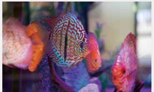
横から見るとほぼ円形で、円盤(ディスク)型の体を持つことから、「ディスクス」と名づけられました。丸山の水槽に4匹います。