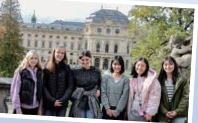
ドイツではバイエルン州ヴュルツブルクの宮殿を訪問 (右の3人が明泉生)