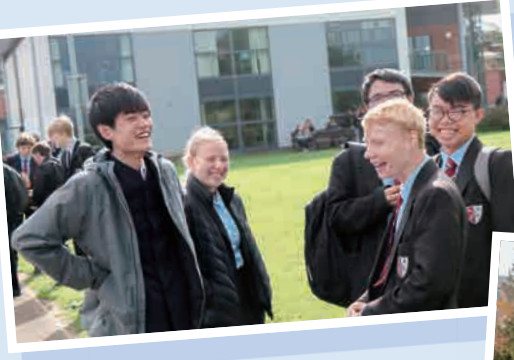
イギリスの高校で

明泉のハイスクールのヨーロッパ旅行は、3週間に3ヶ国をめぐって研修を行います。イギリスとドイツでは同年代の子供がいる家庭にホームステイし、現地の学校で授業を受けました。英語が母国語ではないドイツの人々との交流は、世界共通語としての英語の重要性を改めて認識できる貴重な機会です。また、フランスの一日観光では、さまざまな名所をめぐって教科書でしか知り得なかった悠久の歴史と文化を自分の目で見ることができました。これらの経験が、これからの学校生活や進学の中で多彩な選択肢を与え、生徒達が自分の輝ける場を国内外で探して行ってほしいと願います。