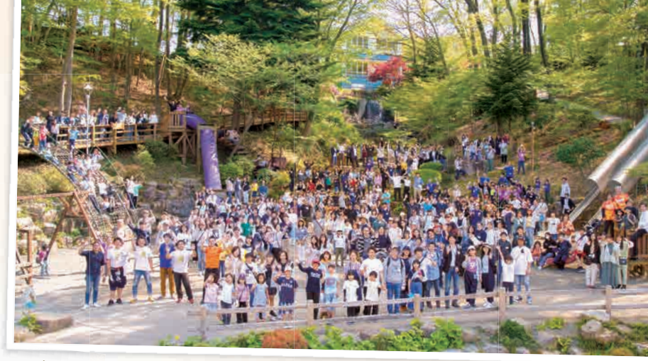
▲3年ぶりに去年開催した同窓会には約500人が集いました

友だち登録の方法：LINEアプリの「友だち追加」メニューで「QRコード」を選択し、左記のQRコードを読み取ると友だち追加ができます。明泉バスのキャラクターのスタンプも販売中です！