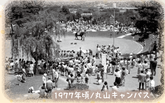
1977年頃/丸山キャンパス

フレンドクラブとプレミアエレメンタリーでは、参観日かねて毎年1学期にフレンズデーを開催します。今年もたくさんのご家族が、緑美しいキャンパスで食事をしたり馬・ポニー乗りなどしながら、初夏の一日を過ごしました。フレンズデーは、開園してまもなくフレンドクラブの参観日として始まりました。当時から、参観の前後に楽しんでもらえるよう馬乗りや馬車乗りを実施していましたが、その後は食べ物の提供、お母さん達のサークル展示や出店、バンド演奏、明泉グッズの販売なども加わり、より一層にぎやかでお祭りのような一大イベントになりました。年長・K5の皆さん、来年はフレンズデーと一緒に楽しみましょうね！