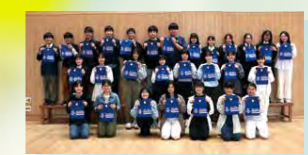
▲ユニフォームTシャツが渡されました

2023年度、中2～高2の同窓生から希望者を募って選ばれ、「Leaders In Training」プログラムが始まりました。これまで同窓会にはボランティアとして園の行事をサポートしてもらっていましたが、このプログラムでは、責任感やリーダーシップの育成に最適な年代の同窓生に、「保護者や子供達に喜んでもらえるように」という園と同じ思いで先生達と行事を運営しながら、ソーシャルスキルを身につけてもらうことを期待しています。フレンドクラブやプレミアエレメンタリーの夏のキャンプでも活動しますので、後輩の皆さんはぜひ気軽に声をかけてくださいね！