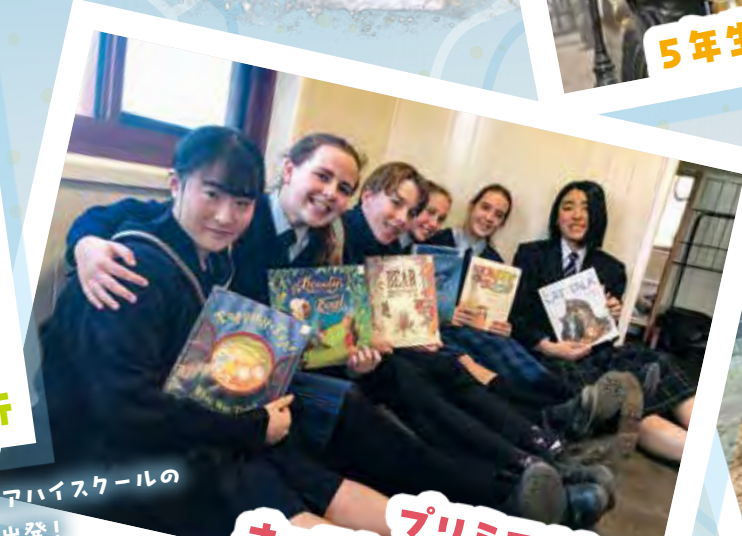
プレミアG8・G9 オーストラリア短期留学