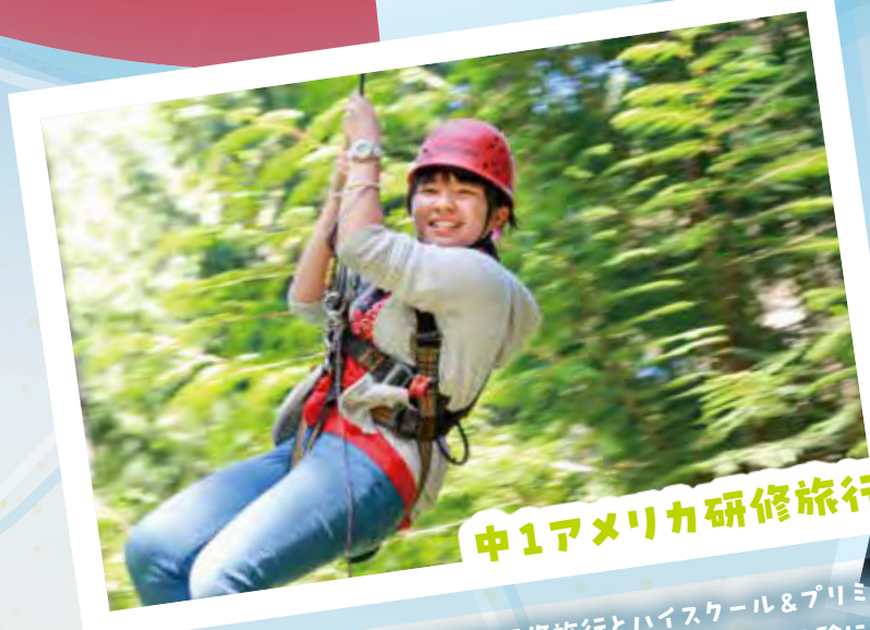
中1アメリカ研修旅行