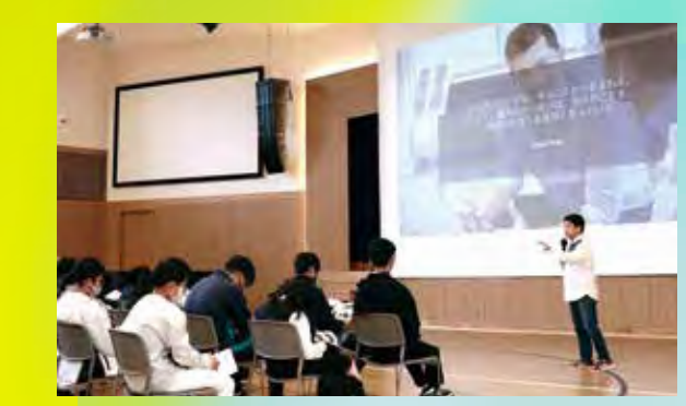
▲活動前のオリエンテーション