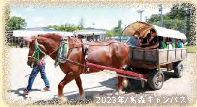
2023年/高森キャンパス