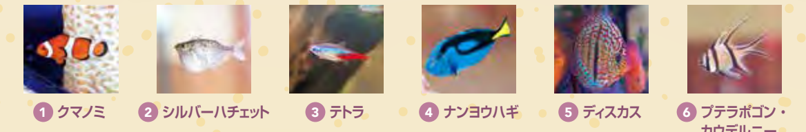
1 クマノミ 2 シルバーハチェット 3 テトラ 4 ナノウハギ 5 ディスカス 6 ブテラボロン・カウデルニー