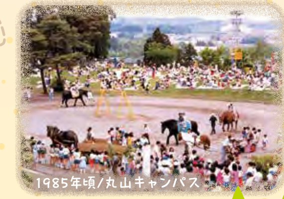
1985年頃/丸山キャンパス