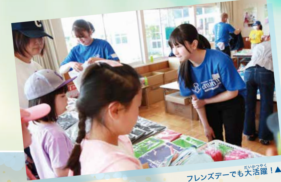
▲フレンズデーでも大活躍！

2023年度、中2～高2の同窓生から希望者を募って選ばれ、「Leaders In Training」プログラムが始まりました。これまで同窓会にはボランティアとして園の行事をサポートしてもらっていましたが、このプログラムでは、責任感やリーダーシップの育成に最適な年代の同窓生に、「保護者や子供達に喜んでもらえるように」という園と同じ思いで先生達と行事を運営しながら、ソーシャルスキルを身につけてもらうことを期待しています。フレンドクラブやプレミアエレメンタリーの夏のキャンプでも活動しますので、後輩の皆さんはぜひ気軽に声をかけてくださいね！